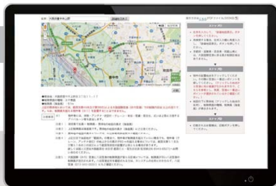
※大阪国際(伊丹)空港画面イメージ

(※)初期設定のため、空港標点の座標とその海拔高、滑走路長や幅等の情報をご提出いただく必要があります。