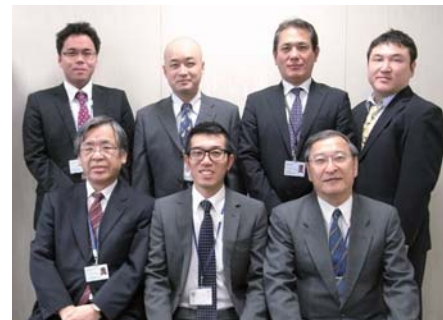
新関西国際空港株式会社 伊丹空港本部 環境・地域振興部 環境管理グループの皆さま

思うように休暇をとることができなかったのですが、システムの導入で問合わせ件数が減ったため、今は自由に休暇を取れるようになりました! また、回答用の FAX 用紙を毎月 800 枚近くも消費していたのですが、それも不要となったため、ペーパーダイエットも実現することができました。